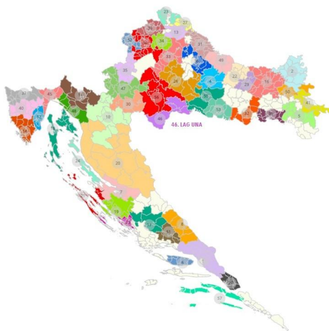
Slika 22: Karta položaja LAG-a na karti Republike Hrvatske